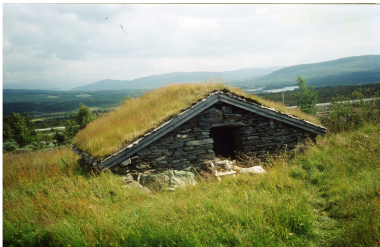
Fjøs Quintusvollen